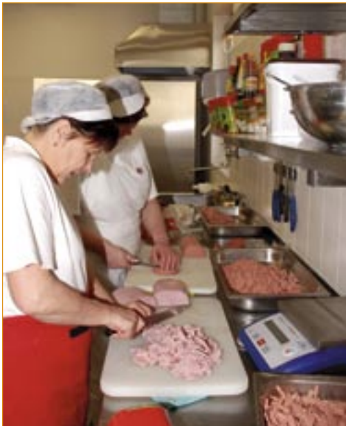
Zaměstnanekyně DORA Gastro