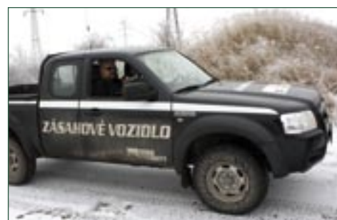
Členové VJ KU 800 DORA Security a.s.